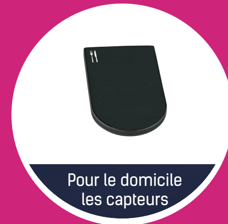
Pour le domicile les capteurs