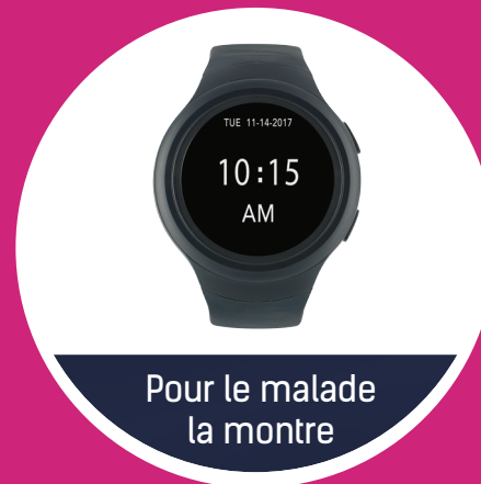
Pour le malade la montre