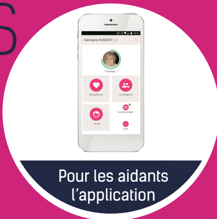
Pour les aidants l'application

Créez votre réseau d'aidants autour de votre proche en perte d'autonomie. Améliorez la communication. Fluidifiez l'organisation. Anticipez les comportements de votre proche. Sécurisez ses sorties.